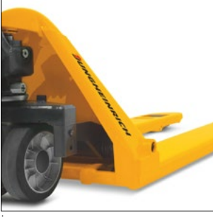
İnce, sağlam çatal uçları