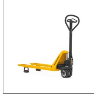
Bakım gerektirmeyen bir kullanım için daimi olarak gresli bağlantılar