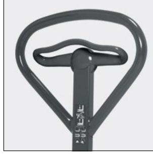
Ergonomik kumanda elemanı